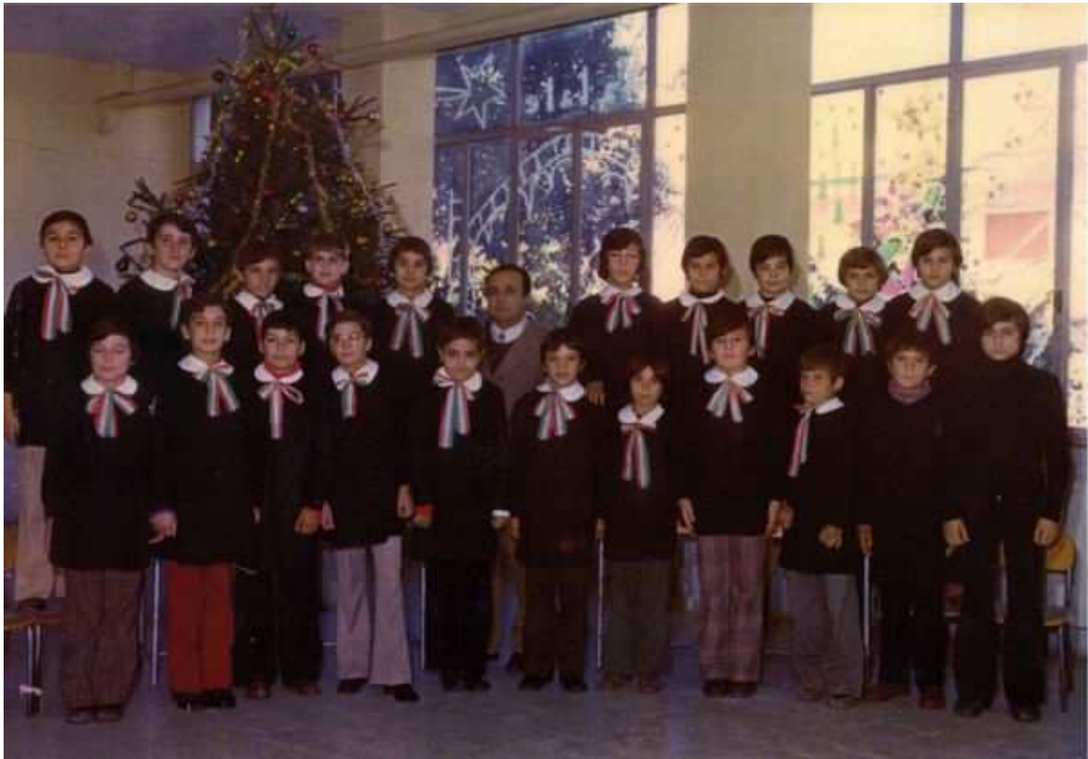
Istituto Scolastico Elementare "Giuseppe Fanciulli" Bellona- Anno scolastico 1975 – 1976